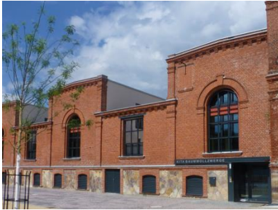
Außenansicht der ehemaligen Spinnerei

Folgendes Bildmaterial stellen wir Ihnen ausschließlich zur Veröffentlichung im Kontext mit dieser Presse-Information zur Verfügung: