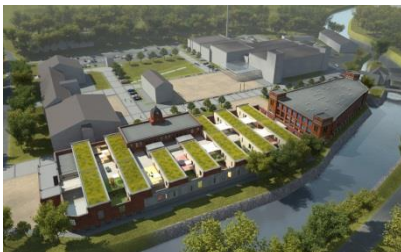
Visualisierung Gesamtanlage

Sie können die Bilder in druckfähiger Qualität anfordern unter presse@opb.de bzw. Tel. 089 57 99 - 484.