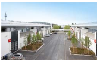
An- und Ablieferzone zwischen den neuen Hallen.