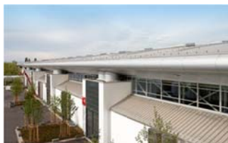
Halle C5 von außen.