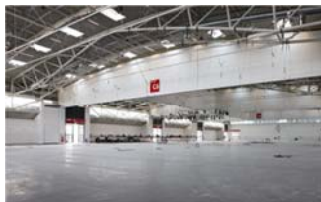
Die individuell unterteilbare Halle C6.