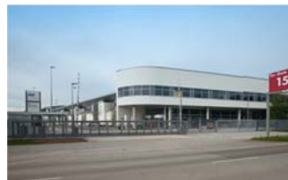
Der neue Eingang Nordost.