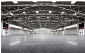
Innenansicht Halle C5.

Folgendes Bildmaterial stellen wir Ihnen ausschließlich zur Veröffentlichung im Kontext mit dieser Presse-Information zur Verfügung. Als Bildquelle ist bei allen Bildern „Obermeyer“ zu nennen.