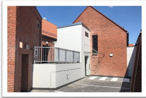
Durch den neuen Aufzug sind alle Ebenen barrierefrei zugänglich.