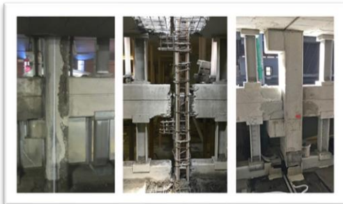
Stütze im Urzustand, freigelegt und in instandgesetztem Zustand.