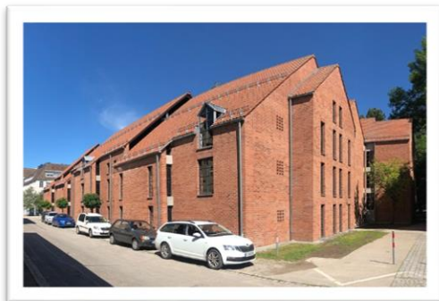
Außenansicht des Parkhauses Krautstraße in Memmingen.

Bitte nennen Sie bei einer Veröffentlichung die jeweilige Bildquelle.