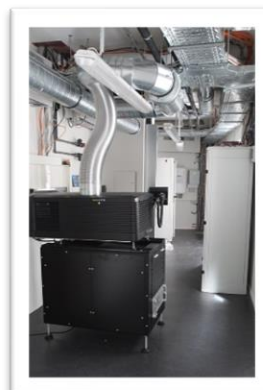
Kinoprojektor im Vorführraum des Theatersaals