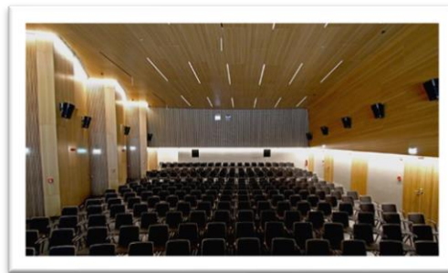
Der Theatersaal bestuhlt.