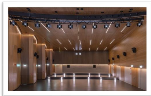
Der große Theatersaal – ein multifunktionaler Veranstaltungsort.