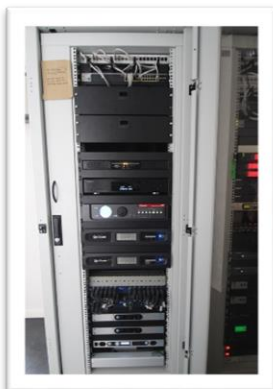
Zuspiel- und Steuerungsanlage im Vorführraum